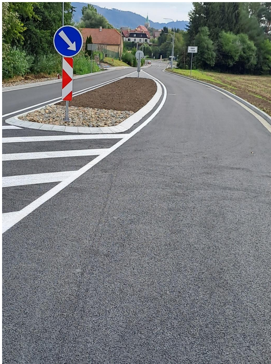
Obrázek 6: Realizace projektu II/337 Třemošnice – hranice kraje