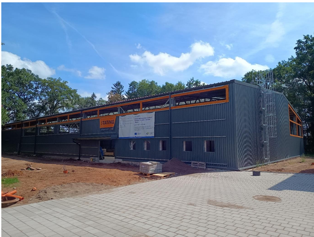
Obrázek 1: Realizace projektu Střední škola chovu koní a jezdeckví Kladruby nad Labem – výstavba jízdárny