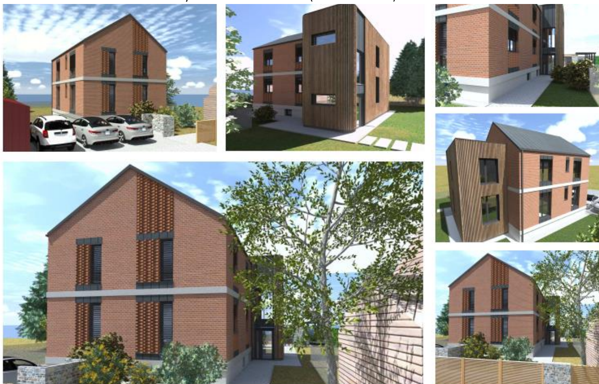
Obrázek 7: Vizualizace Komunitního bydlení Heřmanův Městec (studie Sinc s.r.o.)

Sekretariát Regionální stálé konference Pardubického kraje spolupracoval při tvorbě aktivity Deinstitucionalizace sociálních služeb RAP Pk především s odborem sociálních věcí KrÚ Pardubického kraje, jehož prostřednictvím byli osloveni také všichni relevantní potenciální žadatelé z území Pardubického kraje s žádostí o vyjádření zájmu o realizaci investičního projektu na realizaci transformace zařízení.