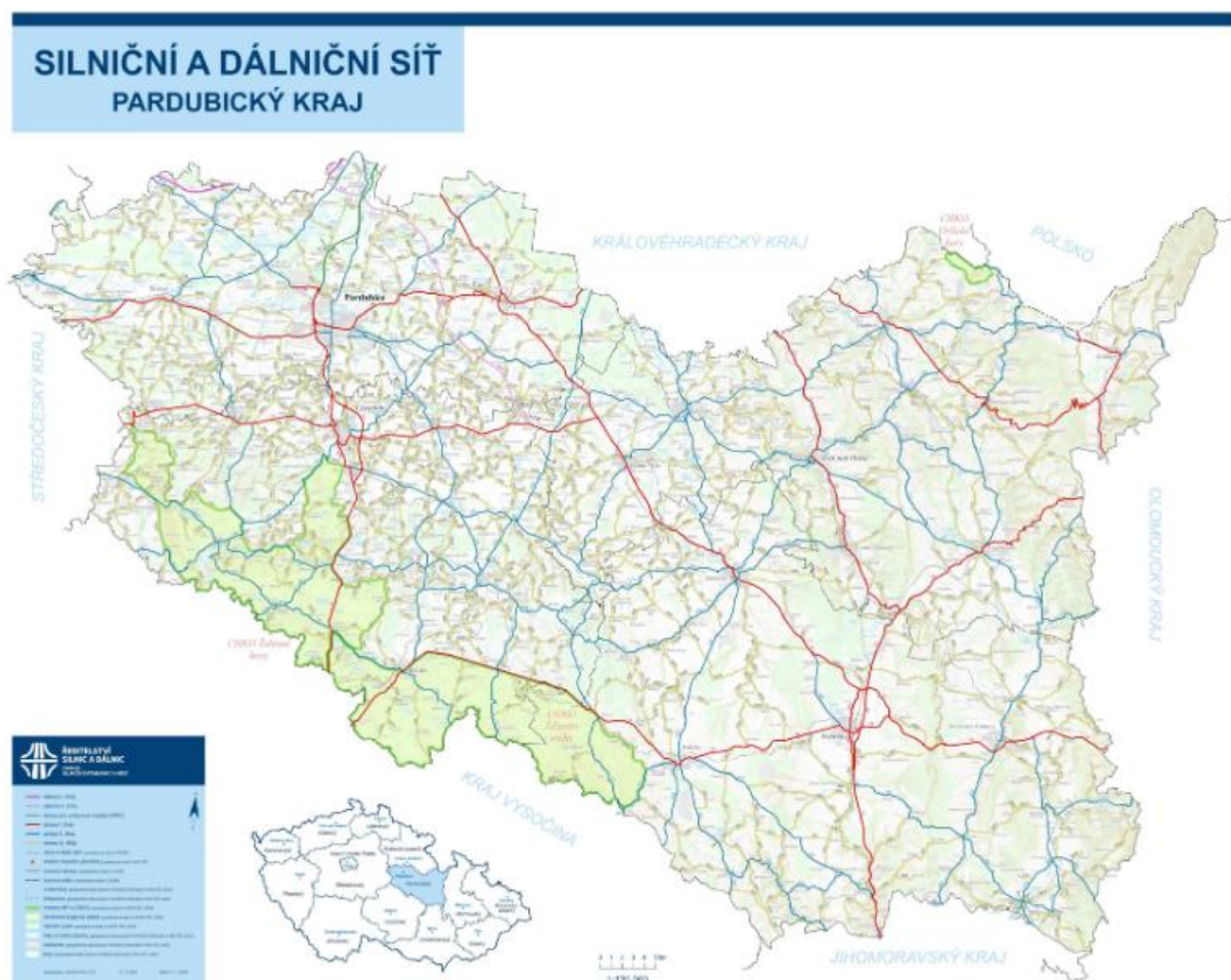
Obrázek 5: Mapa silniční a dálniční sítě Pk k 1. 1. 2024

Sekretariát Regionální stálé konference Pardubického kraje spolupracoval při tvorbě aktivity Silnice II. třídy RAP Pk s následujícími subjekty: